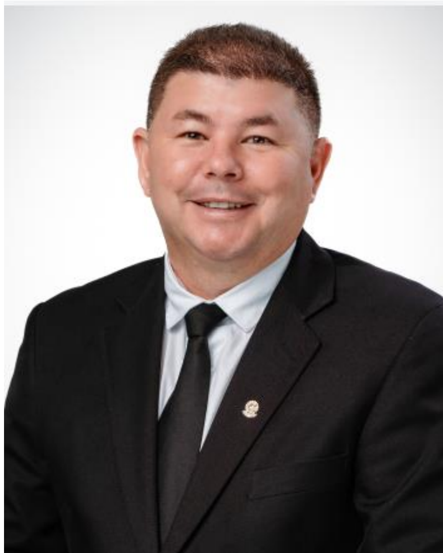
Ediomar de Carvalho Presidente