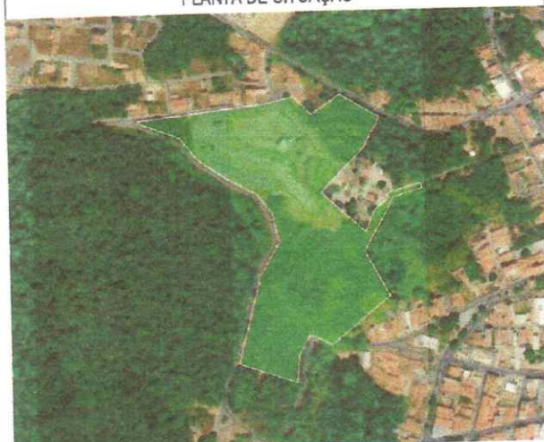
Viçosa do Ceará